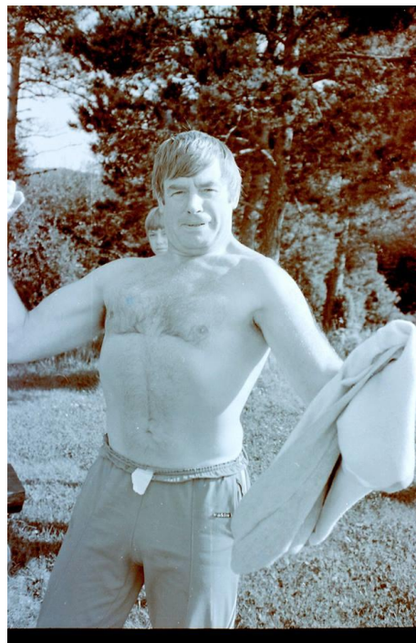
"Super-Mac" på 70-talet.